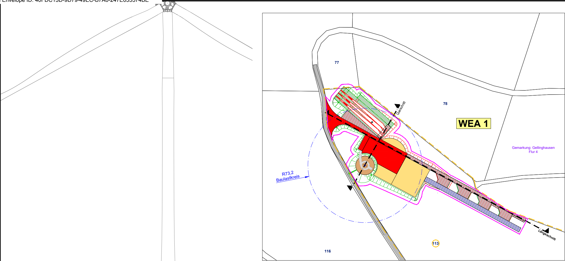
Lageplan WEA 1 Maßstab: 1: 2.500